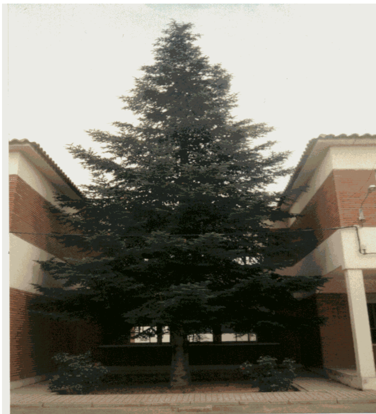
El gran abeto

siendo tronchados o maltratados o, simplemente, descuidados y quedaron en el camino.